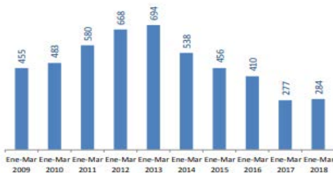
Tabla 4: Miembros de la Fuerza Pública Heridos en Actos del Servicio

Fuente: Ministerio de Defensa, Logros de la Política de Defensa y Seguridad Todos por un Nuevo País.