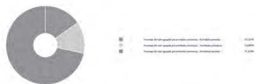
Gráfico 2. Porcentaje del valor agregado por actividades económicas