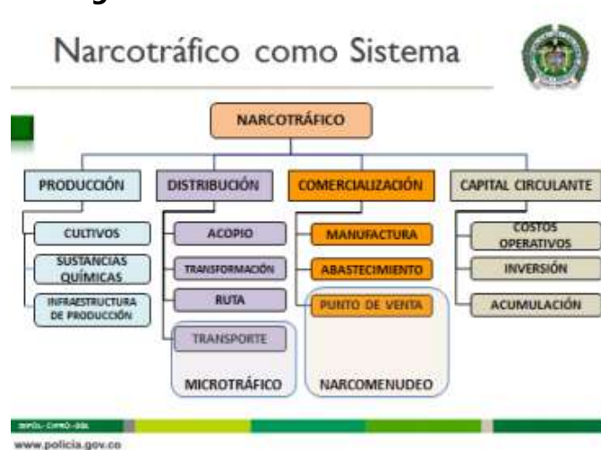
Diagrama 1. Narcotráfico como sistema