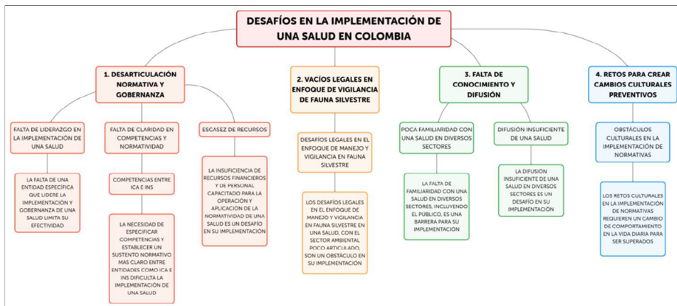
Figura 1. Cuellos de botella y desafíos identificados en las entrevistas a los actores en el mapeo.