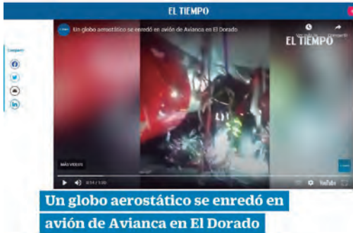
www.eltiempo.com (31 de diciembre de 2021). Recuperado el 24/05/2022 de https://www.eltiempo.com/unidad-investigativa/un-globo-aerostatico-se-enredo-en-avion-de-avianca-en-el-aeropuerto-el-dorado-558177