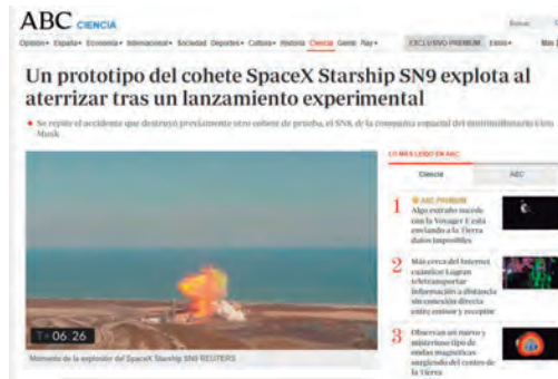
ABC ciencia (03 de febrero de 2021). Recuperado el 24/05/2022 de https://www.abc.es/ciencia/abc-prototipo-cohete-spacex-starship-explota-aterrizar-tras-lanzamiento-experimental-202102022236_noticia.html