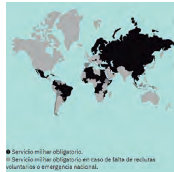
Ilustración 1 Estado actual del SMO a nivel mundial.

El siguiente gráfico presenta el estado actual del servicio militar a nivel mundial.