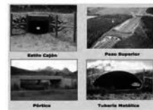
Figura 1. Parra, V.J., & Rincón Alarcón, D. P. Guía General para el Manejo de Fauna Atropellada en Vías en Concesión (Tramo 2 Autopista Bogotá-Villeta).