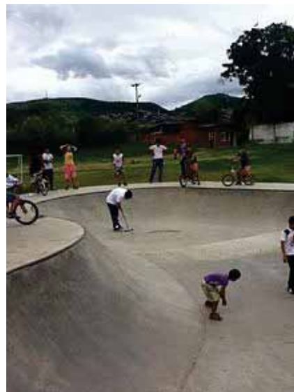
☞ Skatepark Yumbo Valle actualmente en proceso.

El Centro de Convenciones Valle del Pacífico creado por la Cámara de Comercio de Cali ubicado en la zona de Arroyohondo, en la Autopista Cali-Yumbo, es un espacio para grandes congresos, ferias y exposiciones, que puede albergar hasta 5.500 personas en conferencias y 11.000 en conciertos, logrando así uno de los mejores alojamientos modernos en Colombia y Sudamérica.