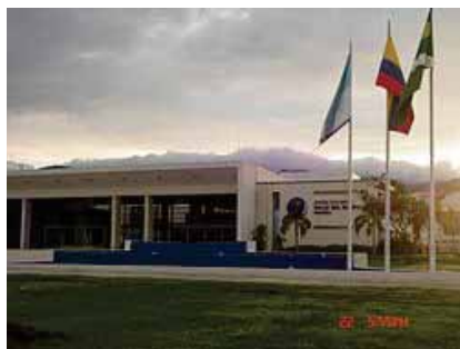
☞ Centro de Convenciones Valle del Pacífico.

Este municipio cuenta con una gran cantidad de personas que apoyan desinteresadamente la cultura, el talento humano, el comercio y la educación. Tiene instituciones educativas públicas y privadas y la Universidad del Valle, Sede Yumbo, que promueven el desarrollo intelectual del municipio.