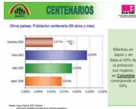
Gráfico N° 3. Comparativo Población Centenaria (99 años y más)

De igual forma, como se observa en el siguiente cuadro, la población adulta mayor en Colombia para el año 2005 correspondía a 3.778.000, es decir el 9% de la población, y se estima que en el 2025 corresponderá a 8.050.700, es decir el 13,5% del total de la población. Y para el año 2025 Colombia ocupará el tercer lugar después de Brasil y Argentina, en proporción de población adulta mayor.