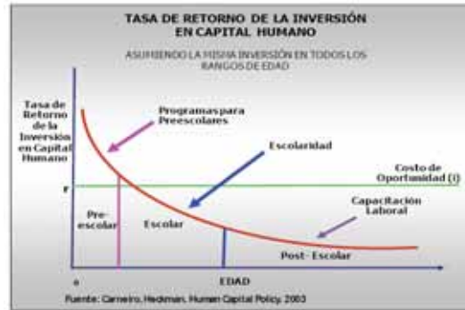
Tabla 1 Tasa de retorno de la inversión en capital humano

Coincide el Conpes 109 13 , que tal como lo describe el premio nobel de 2000 de ciencias económicas, Heckman 14 , “las intervenciones en la primera infancia ofrecen los mayores retornos sociales, al compararse con intervenciones en etapas posteriores”.