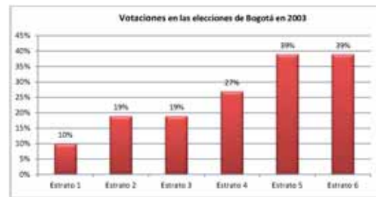
Tabla 2: Votación por Estrato en Bogotá, 2003.

Para la sociedad los beneficios son diversos. Uno de los más importantes es que los distritos uninominales están compuestos por unidades semejantes de población en todo el territorio nacional, lo que obliga que todos los territorios estén representados. La siguiente gráfica muestra cómo los estratos bajos votan mucho menos que los estratos altos (Sudarsky, 2003).