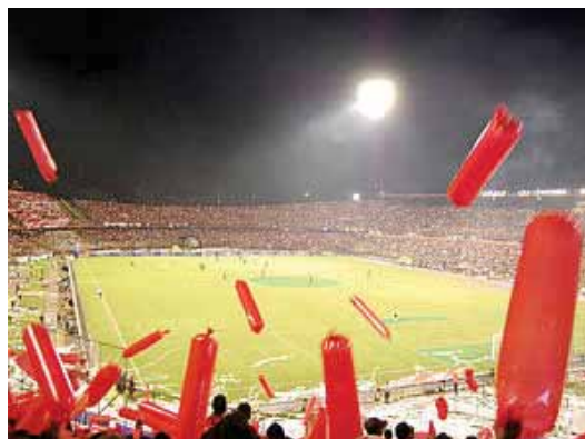
Atanasio Girardot. Final Torneo Finalización 2008.